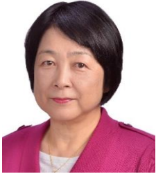
無所属 会派・新しい風・希望

7月に入って新型コロナウイルス感染者数は急速に拡大しており、第7波に入ったと言われております。今後の動向が気になりますが、引き続き感染予防に努めていただけますようお願いいたします。