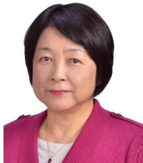
無所属 会派・新しい風

平成30年度最後の定例会となる3月議会では、開会初日に市長の施政方針が示され、平成31年度一般会計・特別会計収支予算案を含む議案25件、陳情1件を審査しました。(ただし、このレポート作成時点はまだ議会開催中で本会議での採決が終わっていません。)